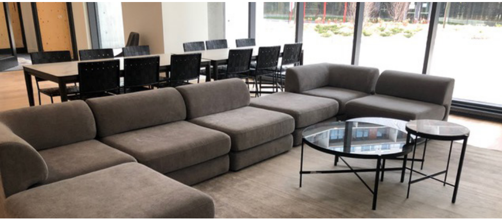
Deux autres salons seront ajoutés au projet.