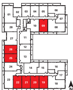
ÉTAGE TYPIQUE / TYPICAL FLOOR

Les meubles ne sont pas inclus. La localisation des portes de balcon et des fenêtres peut varier. Les dimensions finales du plan peuvent varier des dimensions indiquées. Les prix, dimensions et spécifications peuvent varier sans préavis. Furniture not included. Window and balcony door locations may vary. Actual floor area may differ from stated floor area. All prices, sizes and specifications are subject to change without notice. E.&O.E