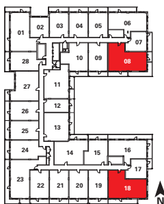
ÉTAGE TYPIQUE / TYPICAL FLOOR

Les meubles ne sont pas inclus. La localisation des portes de balcon et des fenêtres peut varier. Les dimensions finales du plan peuvent varier des dimensions indiquées. Les prix, dimensions et spécifications peuvent varier sans préavis. Furniture not included. Window and balcony door locations may vary. Actual floor area may differ from stated floor area. All prices, sizes and specifications are subject to change without notice. E.&O.E